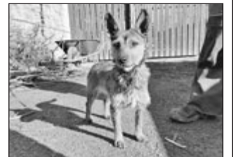
Fena - kříženec malé velikosti a hrubé srsti. Nalezena dne 19. 2. 2020 na ul. Jungmannova. Je velice přátelská.