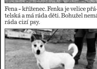
Pes - kříženec krátké srsti v bílo-béžové barvě. Byl uvázaný do záchytné stanice. Pejsek je nedůvěřivý, ale hodný. Pomaličku se adaptuje a získává zpět ztracenou důvěru k lidem.

Psi jsou dočasně umístěni ve vyškovském zooparku, tel.: 517 346 356, 725 726 374.