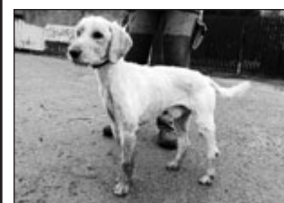
Pes - kříženec střední velikosti, krémově dlouhé srsti. Je přátelský, ale chvilku mu trvá, než se začne přátelit.