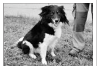
Pes - kříženec border kolie. Je hravý, ale i on ze začátku nevěří cizím lidem, ale jakmile zjistí, že mu nic nehrozí, tak je z něj velký kamarád.