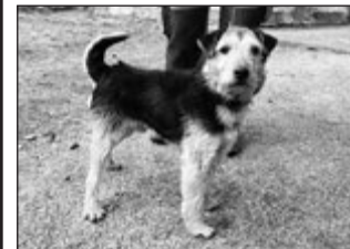
Pes - kříženec střední velikosti a hrubé srsti. Nalezen 23. 1. 2020 ve Smetanových sadech.