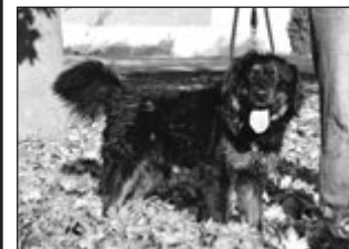
Pes - kříženec střední velikosti se středně dlouhou černou srstí s pálením. Je velice přátelský.