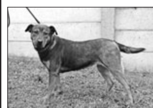
Fena - kříženec. Fena je velice přátelská a má ráda děti. Bohužel nemá ráda cizí psy.