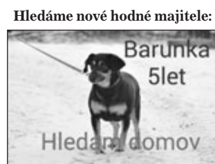
Hledáme nové hodné majitele: