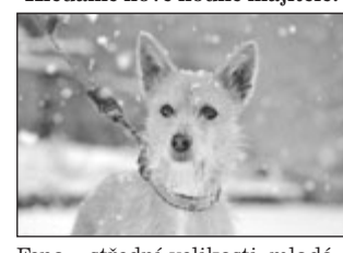
Fena - střední velikosti, mladá - světle rezavá, hrubosrstá. Fenka je hodná, trochu bázlivější.