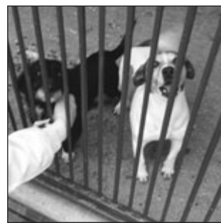
Bob a Bobek