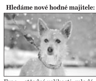
Hledáme nové hodné majitele: