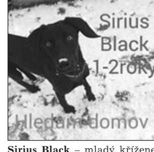
Sirius Black - mladý křížec loveckého typu, veselý a hravý, trochu zbrklý

Psi jsou dočasně umístěni ve vyškovském zooparku, tel.: 517 346 356, 725 726 374.