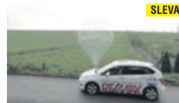
Vážany: rozlehlý pozemek o výměře 2 503 m 2 k výstavbě rodinného domu. Inženýrské sítě v těsné blízkosti. Uliční síř 21,46 m, délka 133,27 m. Klidná ulice, v blízkosti přírody. Makléř: 602 542 995 Cena: 280 Kč/m 2