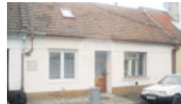
Nemojany: řadový RD 3+1 s menším dvorkem a přístavky ve dvore. Dům je určený k rekonstrukci. Jedná se o vyhledávanou lokalitu a to i k rekreaci. Makléř: 733 149 035 Cena: 436 300 Kč