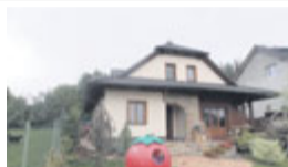
Luleč: novostavba RD 4+1 v Luči. V přízemí kuchyně s jídelnou a funkcemi kachlovými kamny, obývací pokoj, technická místnost, pracovna a šatna. V patře koupelna s WC, ložnice, dětský pokoj se šatnou. Makléř: 602 542 995 Cena: 4 802 000 Kč