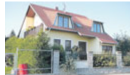
Ivanovice na Hané: komfortní RD 5+1 s garáží, obývací pokoj s krbem, terasa, venkovní posezení s grilem, vrostlá zahrada, kolaudováno v roce 2002, skvělá poloha, útulné bydlení. Makléř: 733 149 035 Cena: 4 250 000 Kč