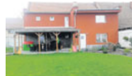
Klíževnice: výkva RD 5+1 po kompletní rekonstrukci. Částečně zařízený. V přízemí kuchyně, obývací pokoj, koupelna, prádelna, vchod do sklepa. V patře 3 prostorné pokoje a koupelna. Makléř: 733 149 035 Cena: 3 181 500 Kč