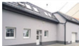
Vyškov: nadstandardní RD se 2 bytovými jednotkami a garáží. V přízemí 2+1. V podkrovní prostory byt 4+1. Kuchyňská linka a společenská zóna. Objekt chráněn zabezpečovacím systémem. Makléř: 602 542 995 Cena: na vyžádání