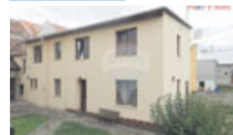
Vyškov: 2 RD s jedním číselným popisem se sam. vchody. Dům o dispozici 3+1 je přízemní, částečně podsklepený v původním stavu. Druhý dům novostavba o vel. 4+kk – vchod ze dvora. Makléř: 733 149 034 Cena: na vyžádání