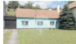
Dřevčice: RD 5+kk, v přízemí zrekonstruovaná kuchyně s obývacím pokojem a ložnicí s koupelnou. V prvním patře dva dětské pokoje s terasou. Za domem terasovitá zahrada cca 787 m 2 . Makléř: 733 352 678 Cena: na vyžádání